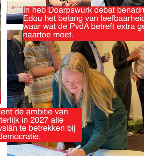
Edou ondertekent de ambitie van Tienskip om uiterlijk in 2027 alle jongeren in Fryslân te betrekken bij de politiek en democratie.