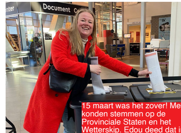
15 maart was het zover! Mensen konden stemmen op de Provinciale Staten en het Wetterskip. Edou deed dat in kleur op NHL Stenden.