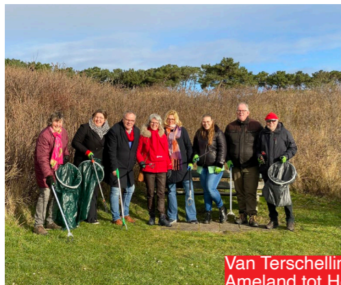
Van Terschelling tot Sneek en van Ameland tot Heerenveen; in aanloop naar de Provinciale Statenverkiezingen waren (kandidaat-)Statenleden door heel Fryslân te vinden.