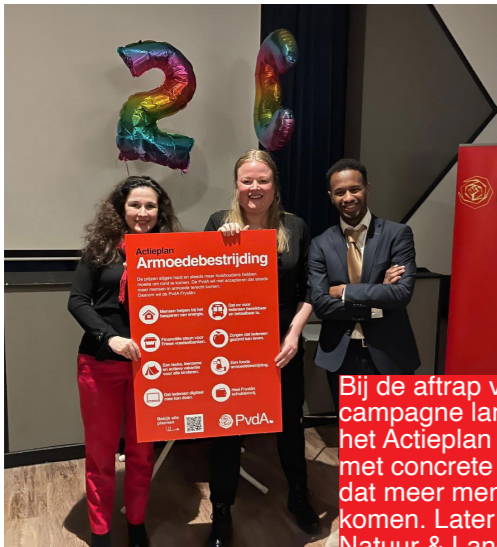
Bij de aftrap van de verkiezingscampagne lanceert PvdA Fryslân het Actieplan Armoedebestrijding, met concrete plannen die voorkomen dat meer mensen in armoede terecht komen. Later volgen de actieplannen Natuur & Landbouw en Senioren.