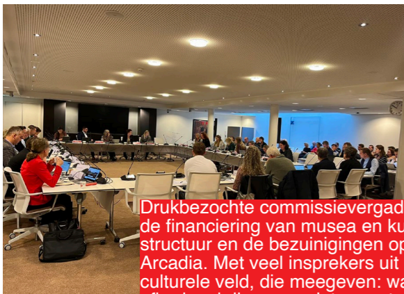
Drukbezochte commissievergadering over de financiering van musea en kunstinfrastructuur en de bezuinigingen op cultuur en Arcadia. Met veel insprekers uit het culturele veld, die meegeven: wat we afbreken krijgen we niet meer terug.