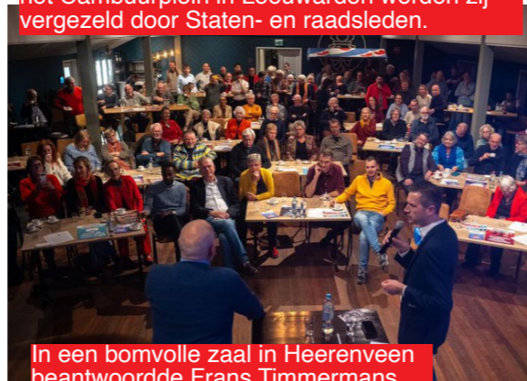
In een bomvolle zaal in Heerenveen beantwoordde Frans Timmermans in het weekend voor de verkiezingen vragen van leden.