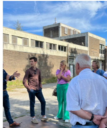
Wat speelt er in Eaststellingwerf op het gebied van wonen, landbouw en openbaar vervoer? De afdeling organiseerde een werkbezoek om PvdA'ers in de Staten, het Wetterskip, de Raad en de Eerste Kamer bij te praten over de ontwikkelingen.