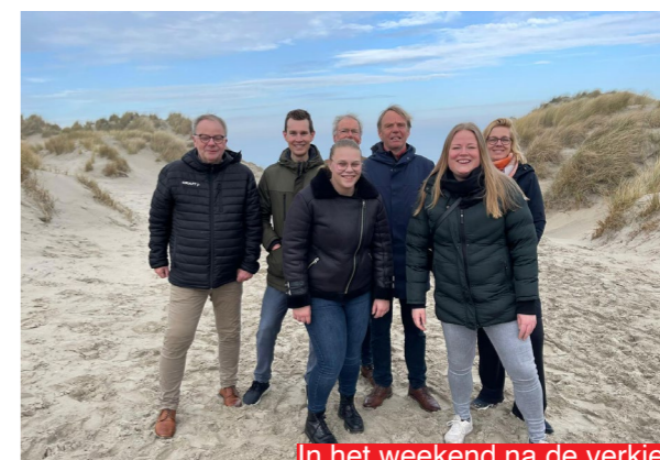
In het weekend na de verkiezingen vertrok de kersverse fractie naar Ameland om de uitslag te bespreken en elkaar beter te leren kennen.