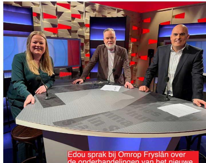
Edou sprak bij Omrop Fryslân over de onderhandelingen van het nieuwe college.