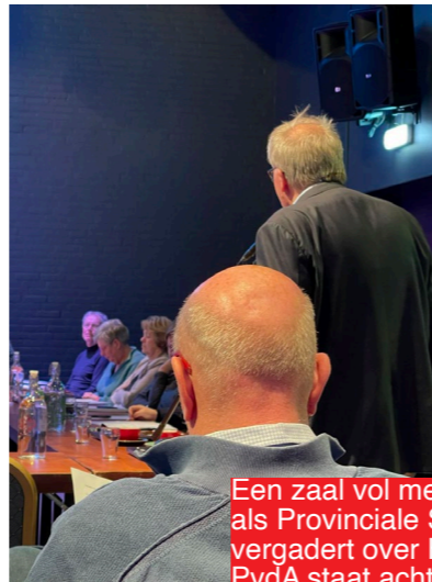
Een zaal vol mensen in Holwerd als Provinciale Staten op locatie vergadert over Holwerd aan Zee. PvdA staat achter dit burgerinitiatief.