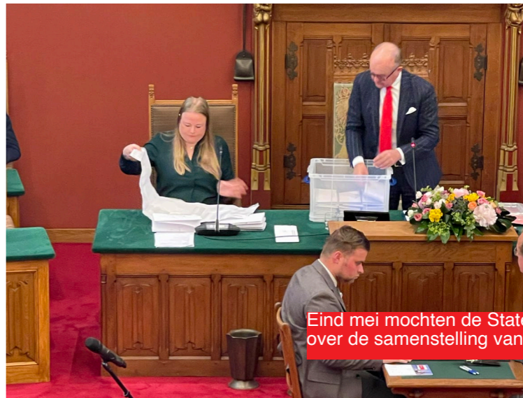
Eind mei mochten de Statenleden stemmen over de samenstelling van de Eerste Kamer.