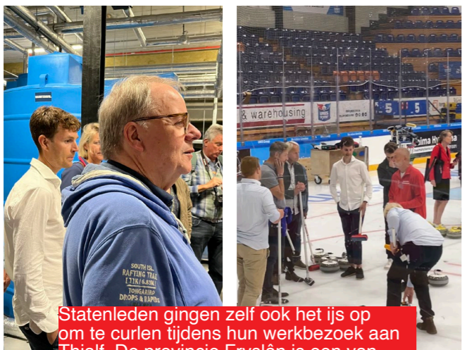
Statenleden gingen zelf ook het ijs op om te curlen tijdens hun werkbezoek aan Thialf. De provincie Fryslân is een van de aandeelhouders, dus de Statenleden werden ook bijgepraat over de financiële situatie.