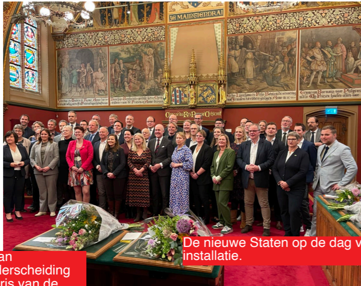
De nieuwe Staten op de dag van hun installatie.