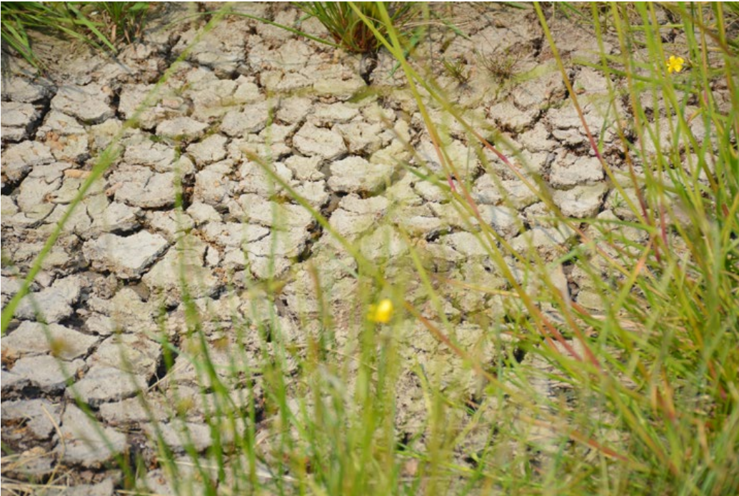
▲ Dat de natuur, zoals hier in de Twizelermieden, kwetsbaar is voor extreme weersomstandigheden bleek dit jaar tijdens de uitzonderlijk droge zomer.

volle toeren... Het jaar 2018 kende een uitzonderlijk droge, warme en lange zomer. Ook nu ijlen daarvan de effecten in de waterhuishouding nog steeds na. Want al ziet het landschap in Fryslân en het Groningse Westerkwartier er weer fris en groen uit, de bodem heeft nog steeds een watertekort.