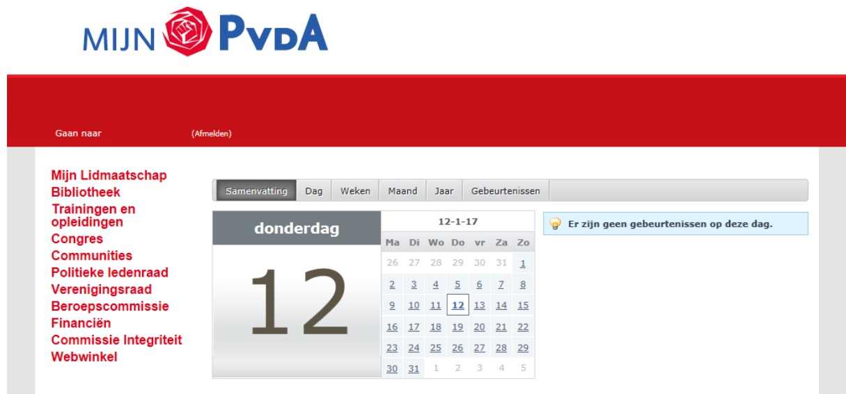
Afbeelding 4. Persoonlijke pagina mijn.pvda.nl

STAP 3: Klik op de knop 'Mijn Lidmaatschap' (links bovenaan in het menu)