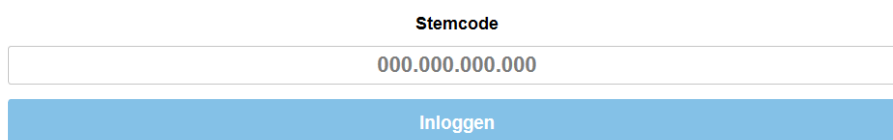
Afbeelding 7. Inloggen met stemcode

STAP 6: Vul de persoonlijke stemcode in die u bij 'Stap 4' heeft gevonden en klik op 'Inloggen'